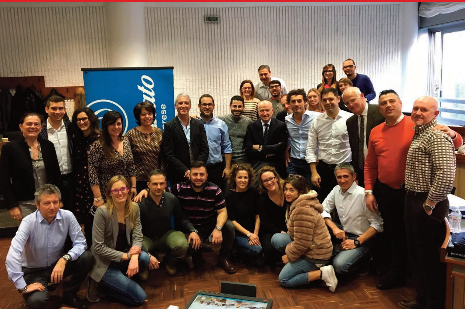
PARTECIPANTI DELLA PRIMA EDIZIONE