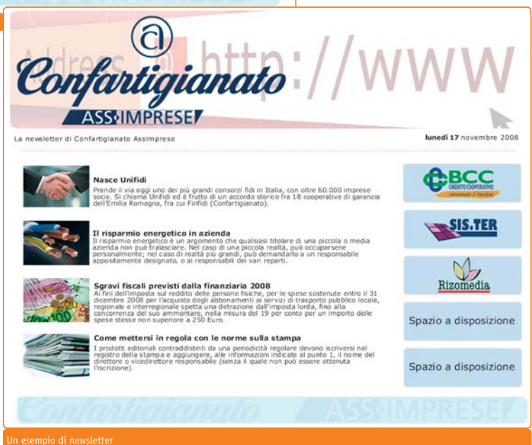
Un esempio di newsletter

Video dedicati: l'associato potrà inserire propri filmati sul portale (video promozionali, schemi di montaggio, descrizione di prodotti...). Confartigianato Assimprese potrà fornire anche la realizzazione dei filmati.