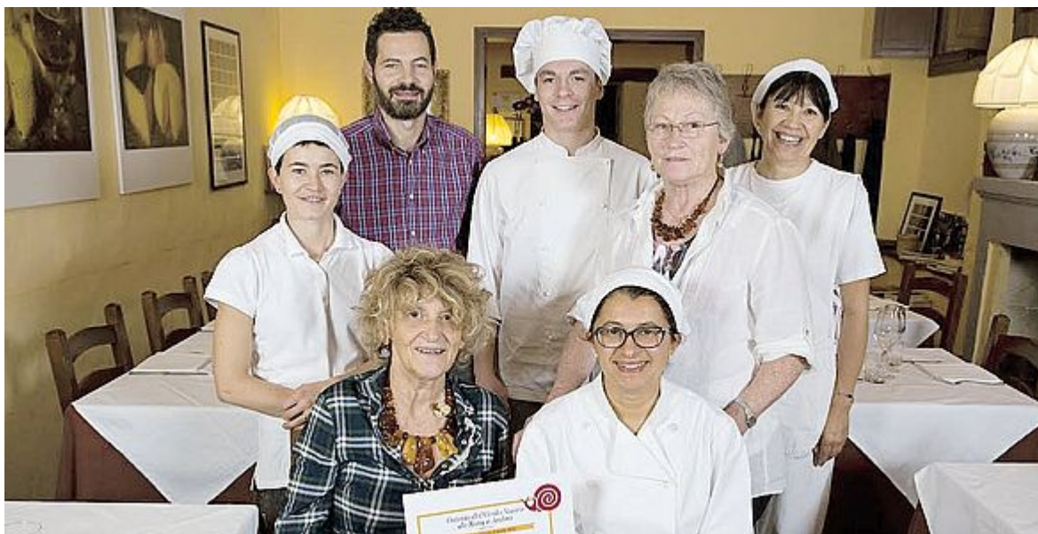
MANGIAR BENE ENNESIMO RICONOSCIMENTO DA PARTE DELLA 'GUIDA ITALIANA'