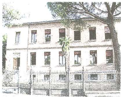
La scuola "Pascoli" tinteggiata a nuovo

Sono terminati i lavori per la messa in sicurezza antincendio e per diminuire la vulnerabilità della scuola elementare "Giovanni Pascoli" di Dozza, che sono stati possibili grazie al piano statale di edilizia scolastica "Scuole sicure" per un importo di 250.000 euro e con 50.000 euro messi a disposizione dal Comune. E' stato messo a norma tutto l'impianto antincendio, sono stati rifatti i soffitti e i controsoffitti delle aule con materiale ignifugo e la caldaia è stata sostituita per diminuire i consumi energetici, inoltre sono state rifatte le scalinate esterne e dotate di ringhiere protettive. E' stato tinteggiato l'interno dell'edificio: le aule con i finanziamenti concessi alla scuole dal governo (programma "Scuole Belle") e i corridoi con il lavoro dei volontari del co-