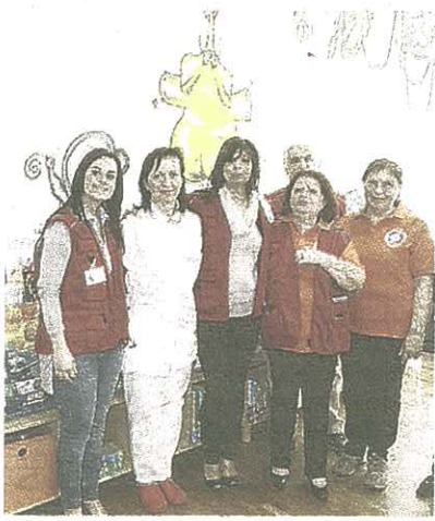
Volontari della P.A. in Pediatria

Si svolgerà a Castel San Pietro il 15° Corso di formazione al primo soccorso sanitario, organizzato dalla Pubblica Assistenza Paolina Città di Imola. La serata di presentazione è in programma domani alle 20.30 nella Sala Sassi in via Fratelli Cervi 3. Il corso è rivolto a tutti i cittadini di età superiore ai 16 anni. E' articolato in 15 lezioni tenute da medici e infermieri qualificati dell'ospedale di Imola e del 118, con lo scopo di preparare alle attività di primo soccorso e di assistenza socio-assistenziale e si rivolge a chi vuole entrare a far parte del Pubblica Assistenza Paolina. L'obiettivo è aprire una sede nella città termale, che andrà a unirsi a quella di Imola in via San Pier Grisologo 42. Fra le novità di questo 15° corso c'è una lezione specifica su tematiche sanitarie legate al bambino (tecniche di disostruzione delle vie aeree). Al termine i partecipanti sosterranno un esame teorico e pratico. Il corso è gratuito e si terrà nella Sala Sassi il lunedì e mercoledì, dalle 20.30 alle 22.30 da domani al 2 dicembre. Per informazioni: (0542) 31583 giovedì dalle 21 alle 23; oppure (348) 9261875 e (349) 2567389; si può inviare una email a: formazione@pa-paolina.it.