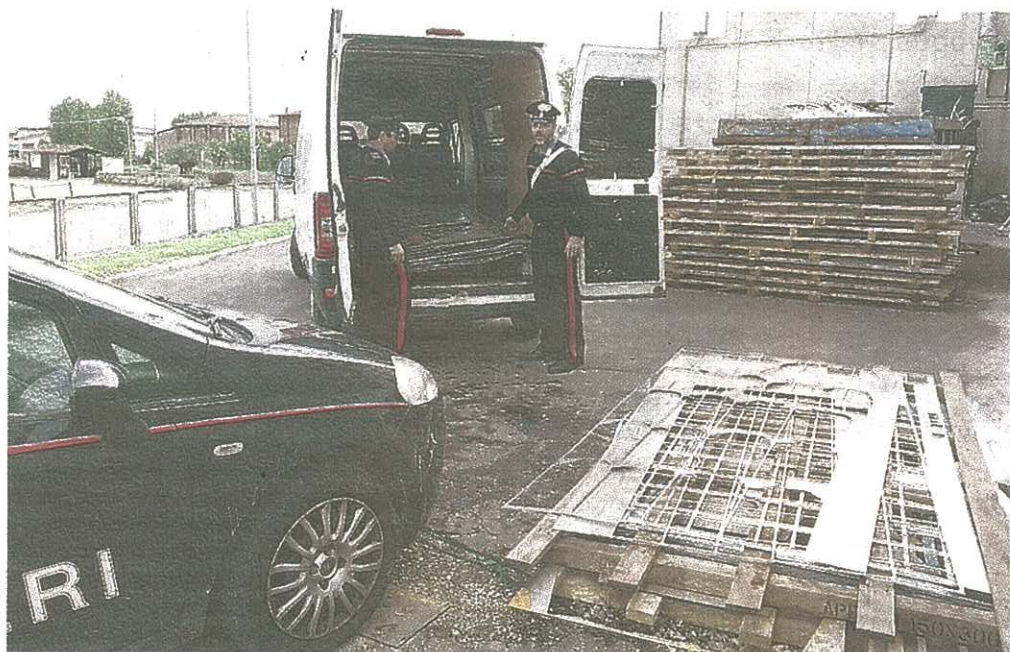
I carabinieri di Castel Guelfo davanti al furgone che stava per essere riempito d'alluminio dai ladri

Di solito è la notte che "ispira" i ladri a penetrare in case e aziende per compiere razzie. Le ore del buio, in particolare, vedono in azione i manigoldi di turno soprattutto quando c'è da fare un colpo nel capannone di una ditta artigiana o di una piccola industria, mentre gli appartamenti vengono depredati anche di giorno con una certa frequenza.