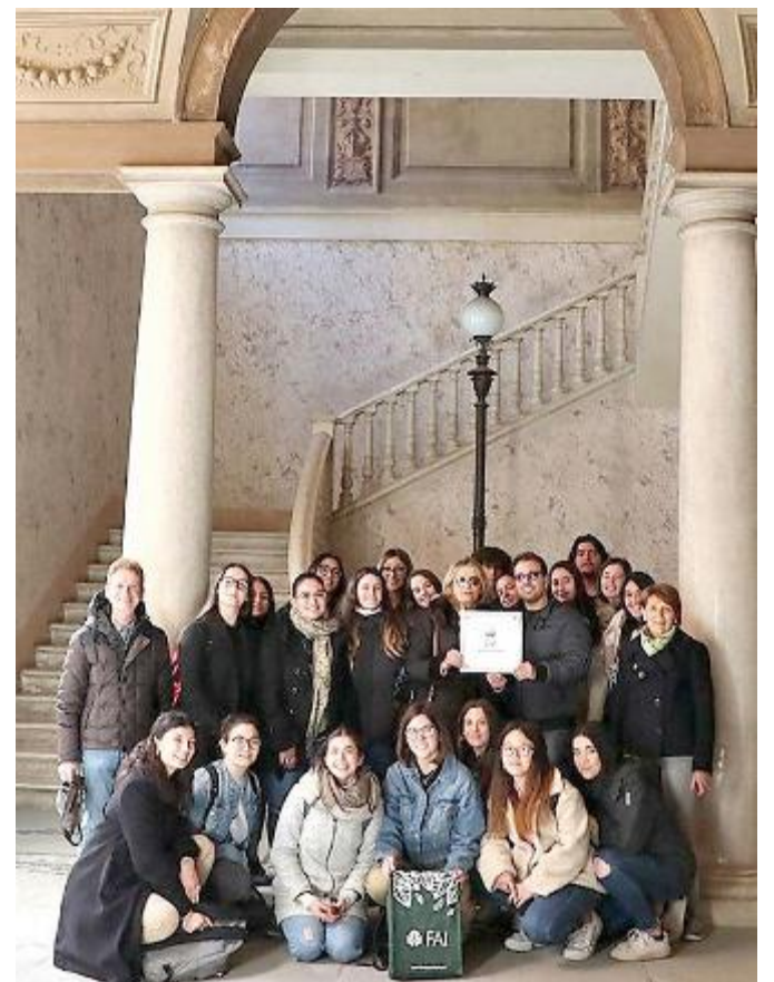
Il gruppo degli studenti in visita a palazzo Vacchi Suzzi