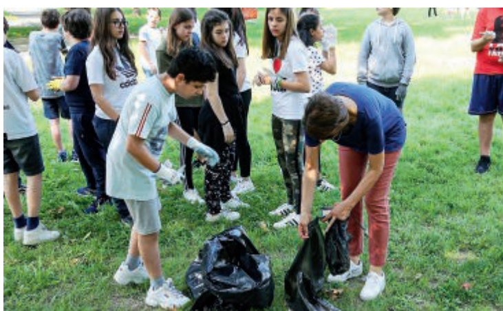
La raccolta rifiuti al parco di via Kolbe

lungofiume del Santerno, nel tratto dalla diga all'altezza della Tosa fino al Ponte della ferrovia (all'altezza di via Graziadei). Il ritrovo è alle 9.30 all'ex Riverside. All'opera un'ottantina di persone, divise in quattro squadre: i volontari avranno il supporto delle Guardie ecologiche volontarie, dei volontari della Protezione civile e dei vigili del fuoco. Nel caso si presentasse un numero di volontari superiore, si potrà procedere alla puli-