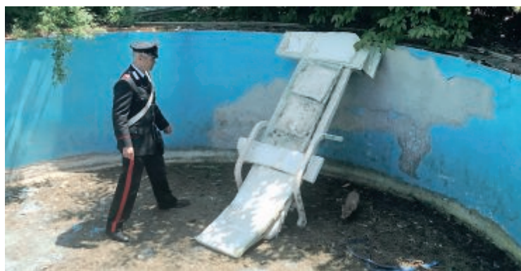
La volpe all'interno della piscina senz'acqua

È successo a Mordano: i militari allertati da un cittadino che pensava si trattasse di un cane