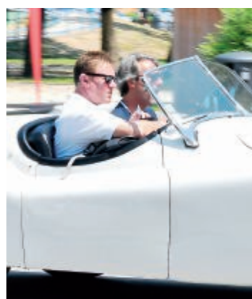
Simon Le Bon in corsa

Nel prato davanti alla storica fortezza saranno parcheggiate le 105 auto storiche, che il pubblico potrà ammirare. Gli spazi all'interno della Rocca, dal cortile maggiore ai camminamenti, saranno utilizzati per ospitare il pranzo di circa 300 partecipanti, fra equipaggi e membri dell'organizzazione. L'arrivo nel prato davanti alla Rocca della prima auto storica, proveniente dal-