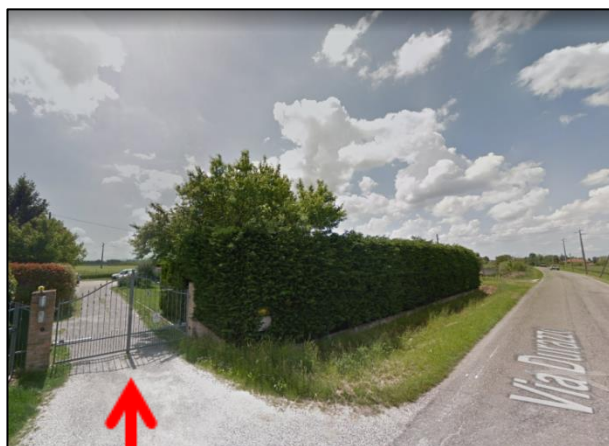
Vista dell'Ingresso da Via Durazzo