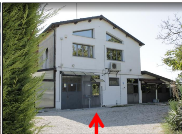
Sede dell'Azienda Baroni Group SRL

Per informazioni contattare il Servizio Ambiente e Sicurezza ( Telefono 054242112 e-mail: sicurezza@assimprese.bo.it )